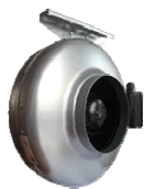
MARS GDF ("ERA" Ltd.)