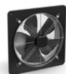
Исполнение 03 на пластине