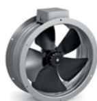
Исполнение 01 с фланцами