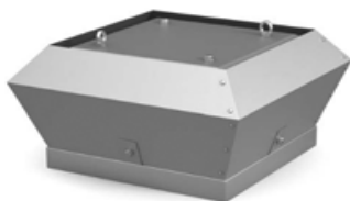
Крышные вентиляторы VKR