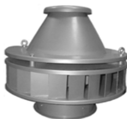
Крышные вентиляторы ВКР