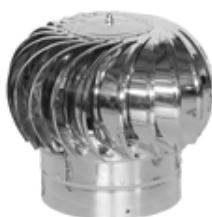
Ротационный дефлектор ТД